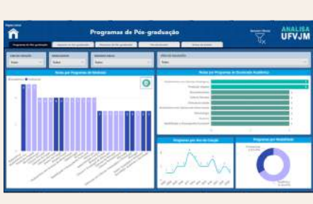
Fonte: Análise UFVJM